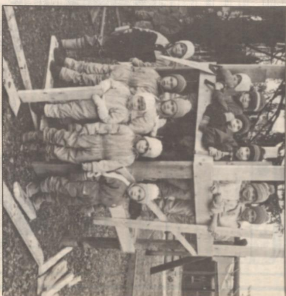
15 eller 18 barn? I Nordmaling har en intressekonflikt blossat upp.

— Även detta talar emot att vi ska pressa in ytterligare barn på våra avdelningar, menar personalen som mycket väl känt av föräldrarnas reaktioner sedan politikernas