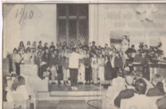
•Kören Futurum sjöng i pingstkyrkan i Nordmaling.

I lördags var det inte mindre än fem olika arbetslag som jobbade med att ta ner de gamla stolparna och sedan dra ledning och armaturer till de tidigare uppsatta nya stolparna. Tjugoen mannar plus ett par ungdomar jobbade från tidigt på lördagsmorgonen med olika uppgifter. Ännu återstår det många timmars jobb, men innan snön kommer så är det meningen att det skall vara klart.