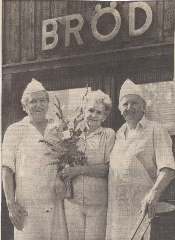
• När Forsbergs bageri i Lögdeå på lördagen stängdes efter 43 års verksamhet var det många kunder som kom med lyckönskningar om en skön ledighet efter många års slit.