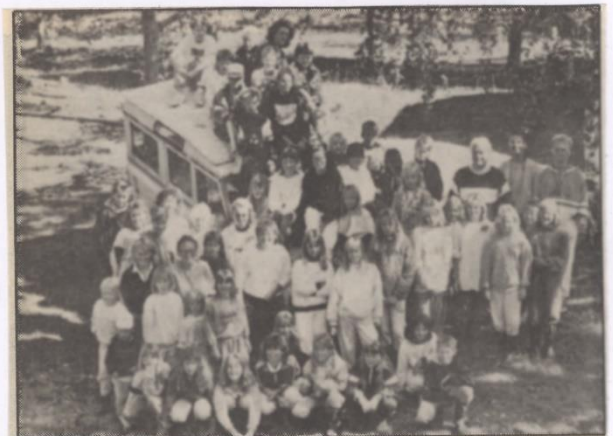
• Deltagare och ledare på skattsökar-lägret i Fårskär. Tillsammans har de gjort allt vad man skall göra på sommaren.