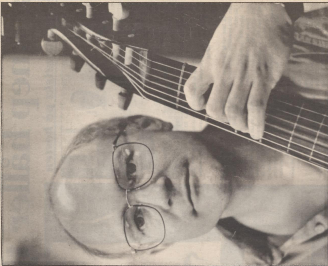
● — Varje barockstycke bär en sorts historia, som man själv måste göra sig en inre bild av. Lyckas man inte med det har man inte förstått musiken, säger Jaap ter Linden som ställer höga krav på själva tolkningsakten i barockmusiken.