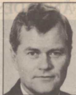
• P A har öppnat "eget"