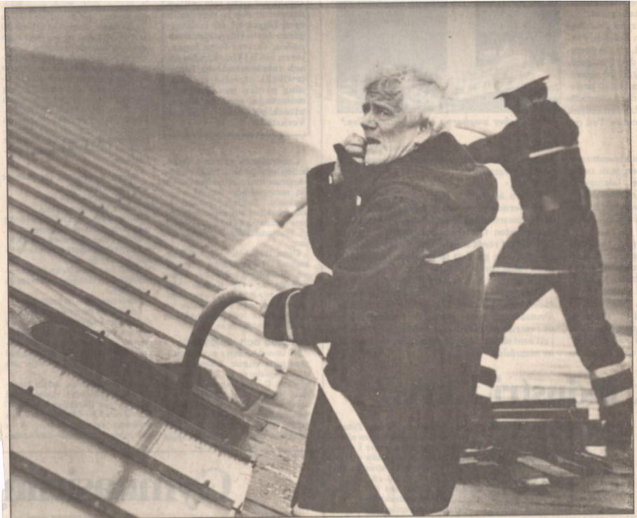
• Genom att krossa den glasade takkupan lyckades brandmännen under stor möda begjuta branden med vatten.