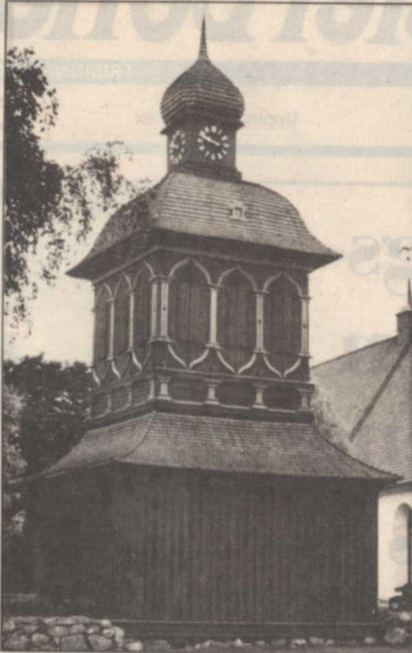
• Nordmalings gamla medeltidskyrka har under barockfestivalen blivit kulturellt centrum i Västerbotten.

Med hjälp av ett fint och väl värdat kontaktnät bland barockmusiker har Puu lyckats skapa en stark stomme i festivalen. Och den lokala förankringen har hjälpt till. Många frivilliga från Nordmaling är en förutsättning