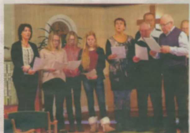
Julottekören i Hörnsjö missionskyrka.

Begravningsgudstjänsten sker i kretsen av de närmaste. Tänk gärna på Världsnaturfonden WWF pg. 90 19 74-6.