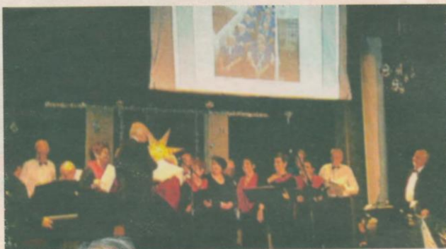
Bjurholms PRO samlades och trivdes i Folkets hus i Rundvik.

Kvällen var en succé. Bjurholms PRO-medlemmar riktade ett tack till alla inblandade.