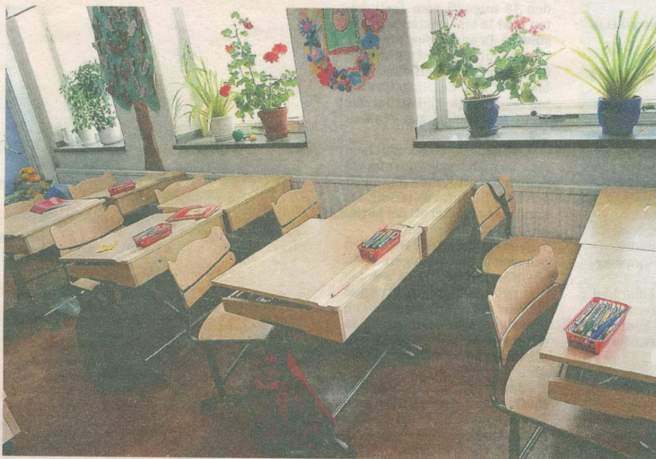
I samband med diskussionerna om skollokalerna som nu blir tomma i Nordmaling har frågan väckts om att starta en friskola i Lögdeå.

- Det har ännu inte kommit in någon formell ansökan, men jag vet att det finns funder-