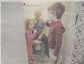
Familjen får gå upp tidigt på morgnonen för att barnen ska hinna med skolskjutsen.

– Vad jag inte kan förstå är varför politiker hade så brist-