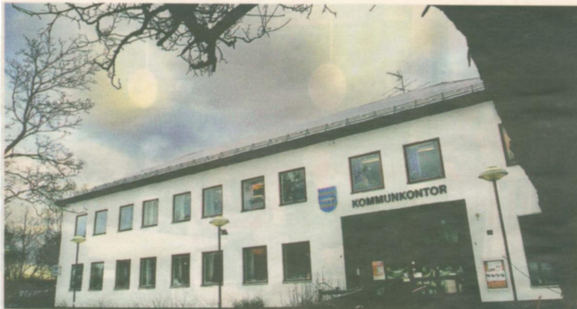
Nordmalings kommun förlorade i Kammarrätten och ska nu betala nästan 800 000 kronor till två fria förskolor.