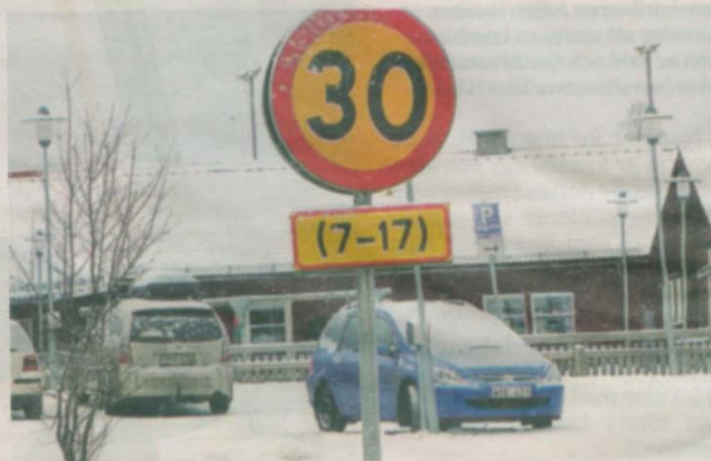
Hastighetsskylten vid Gräsmyrs skola visar att man ska köra 30 mellan klockan 7 och 17 på lördagar och dag före röd dag.