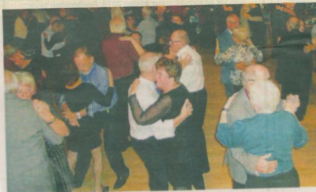
PRO Nordmaling dansade in nya året till Barrabazz.