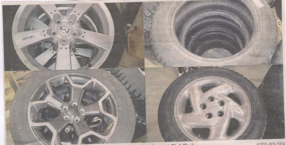
Två män, som fraktat stulna däck genom länet, åtalas bland annat för häleri.

Det blev en hel del frågor om allt som visades.