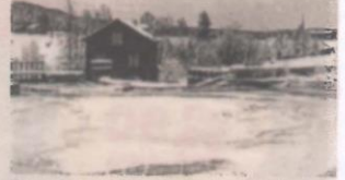
Kvarnen i Hörnsjö hade en gång i tiden en viktig funktion.

Byns kvarn var också väldigt viktig och en plats där många möttes. Medan den var i bruk och många år efteråt fanns där en kvarndamm. Dan visade bilder från en gröttfest på Missionskyrkan, slätterfika, släkträffar och begravning. En bild