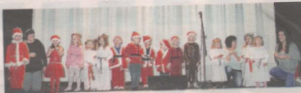
Luciatåget från Bergslyans dagis.

Alla barnen hade lärt sig en massa sånger och de sjöng högt och frimodigt med stöd av förskollärarna. Man sjöng luciasången redan i dörren och hela luciatåget vandrade runt mellan borden i ett långt luciatåg och till sist hamnade alla i luciatåget uppe på scenen. Sångare som framfördes från scenen var bland annat Tomtarnas julnatt, Tre pep-