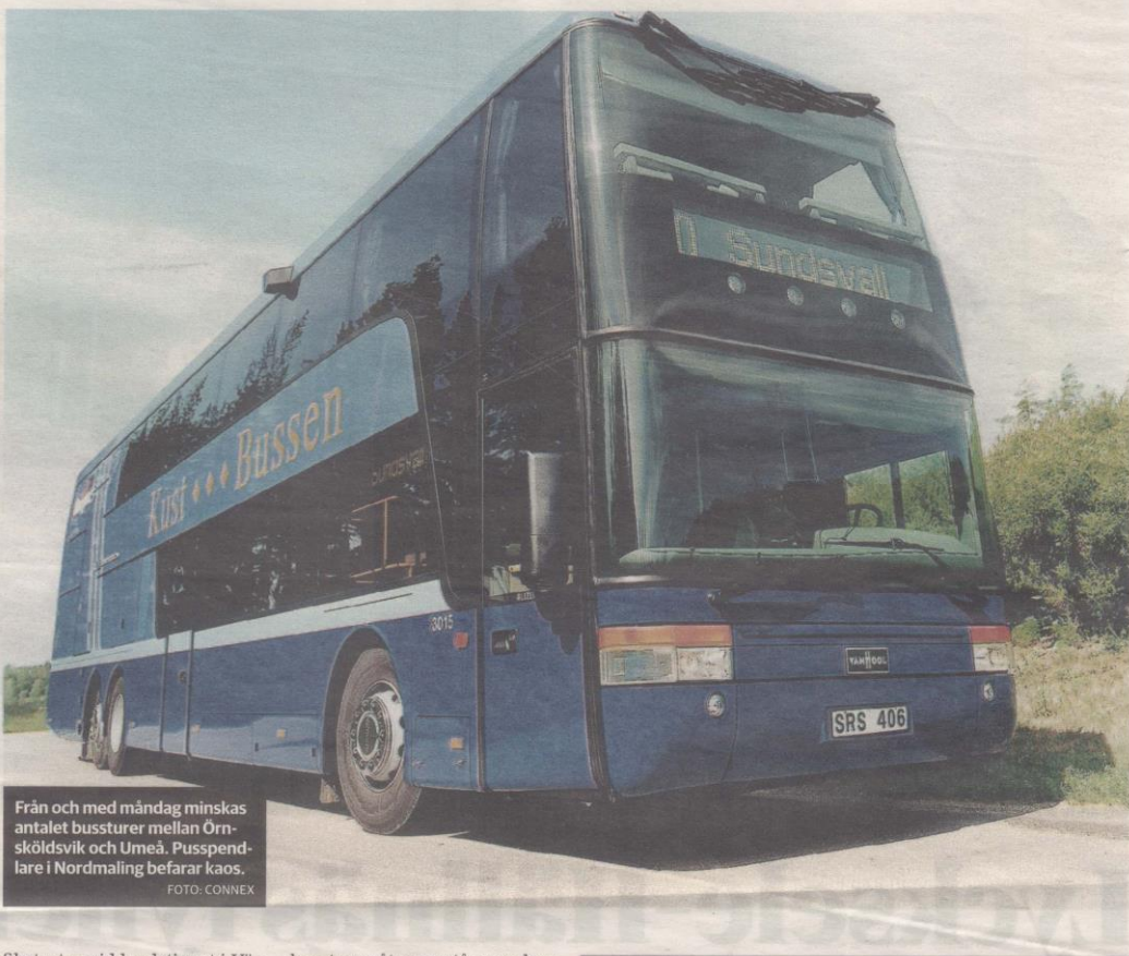
Från och med måndag minskas antalet bussturer mellan Örnsköldsvik och Umeå. Pusspendlare i Nordmaling befarar kaos.