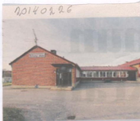
Respit för skolan i Gräsmyr.