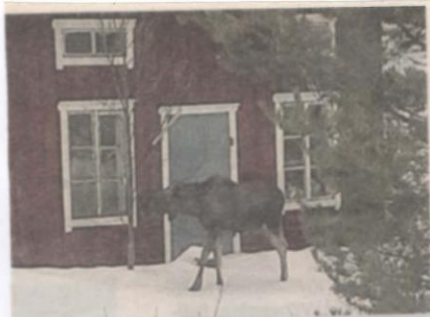
En älg besökte i går Rundvik.