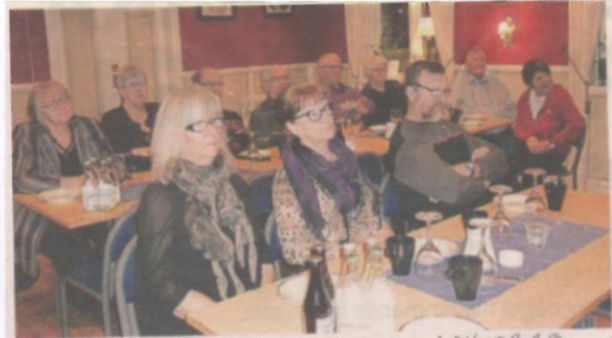
PRO Nordmaling träffades nyligen till afterwork. 2014 02 20