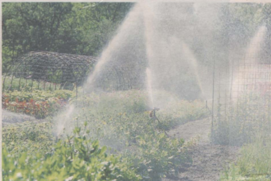
Den extremt torra väderleken har gjort att Nordmalings kommun nu uppmanar kommuninvånarna att spara på vattnet.

Enligt SMHI:s prognos för de närmaste tio dagarna, väntas inga sammanhängande neder-