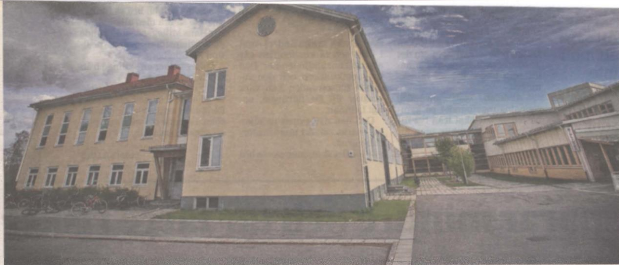
Utöver rektor har även fem lärare, sex med den som slutade under våren, sökt sig till nya jobb - från Artediskolan i år.