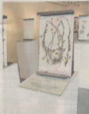
Vetenskapsmannen Peter Artedi (1705-1735) växte upp i Nordmaling från 11 års ålder. I morgon öppnar en utställning till hans minne.