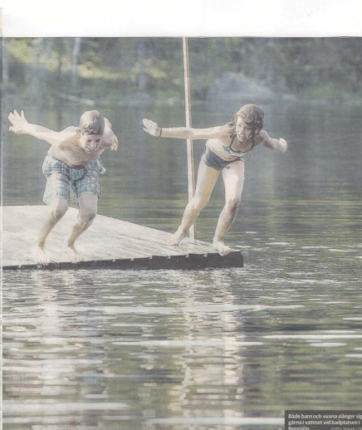
Både barn och vuxna slänger sig gärna i vattnet vid badplatsen i Bergsjön.