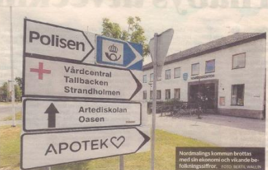
Nordmalings kommun brottas med så ekonomisk och växande befolkningsproblemer.

Rösterna från viktiga frågor 1. Utvärdering 2. Kommunens ekonomi 3. Byggnadsfrämjande