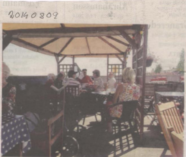
Hörselskadades förening i Nordmaling njöt i solskenet på sommarträffen.

Deltagarna fick solsken, havsluft och glatt sällskap och dessutom en trevlig lärörrik dag att minnas från denna dag.