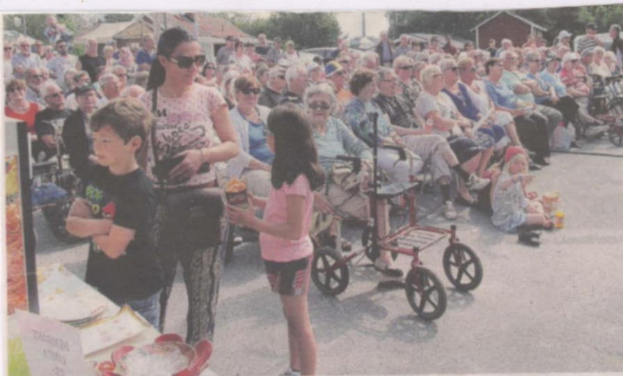
Rundviksdagen lockade många besökare med strålände sol, underhållning och mat.