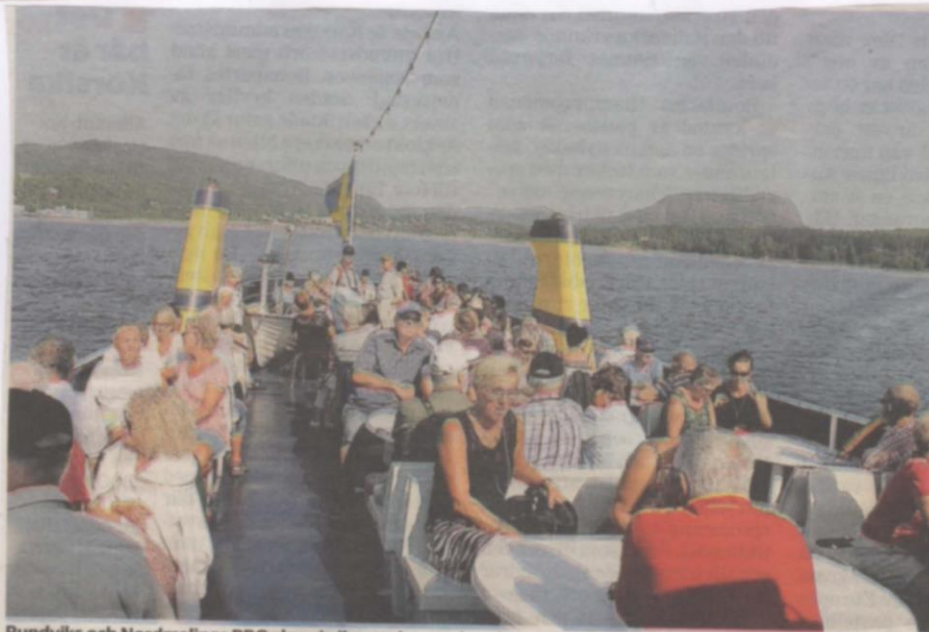
Rundviks och Nordmalings PRO slog sig ihop och spenderade en dag på Ulvön.